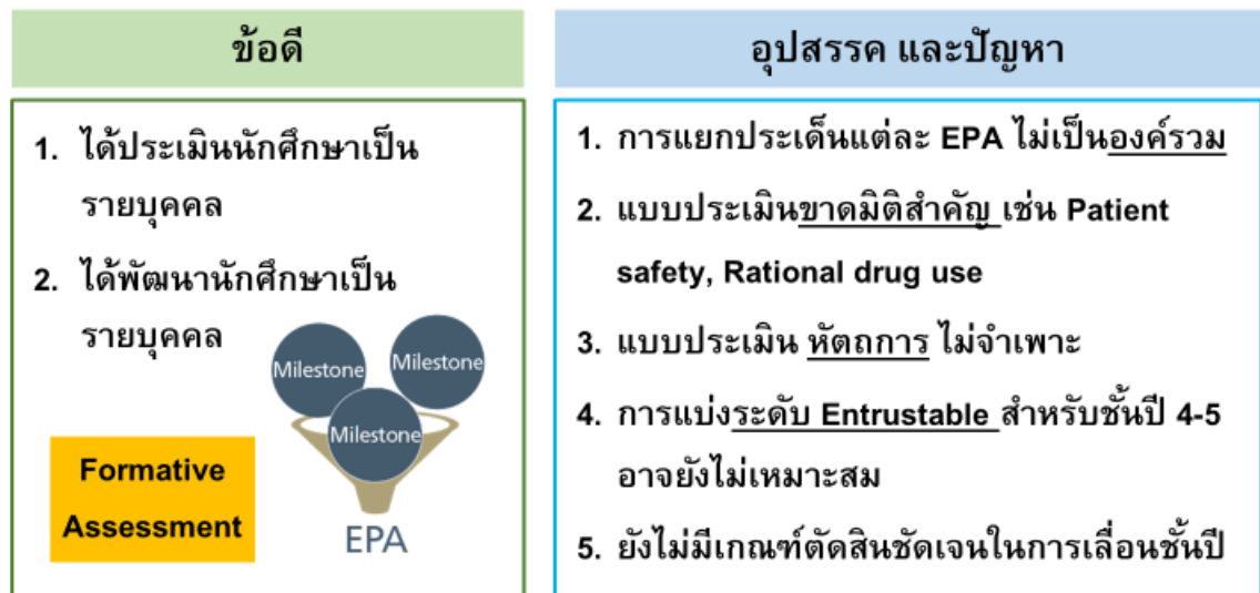
รูปที่ 2 ข้อดีและข้อจำกัดของ EPA

ด้านการจัดการเรียนการสอน คู่มือได้แสดง 1) milestones ด้านความรู้ของภาควิชาหลัก สำหรับ PLO 2 (ความรู้) และ PLO 3 (ทักษะทางปัญญา) 2) milestones การทำหัตถการตามเกณฑ์แพทยสภา และ 3) milestones ด้านการสังเกตและแปลผลของภาควิชาหลัก สำหรับ PLO 6 (ทักษะพิสัยเฉพาะวิชาชีพ)