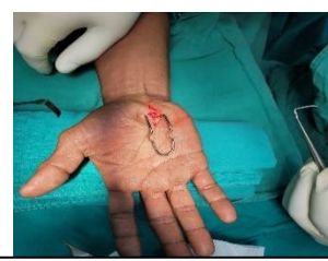
Carpal tunnel release Rt wrist

ปัญหาที่พบ แรงยึดหยุ่นในการถ่างแผลไม่สม่ำเสมอ