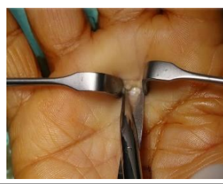
A1pulley release middle finger Rt hand