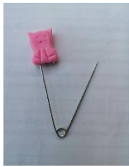
เข็มกลัด

๒. แนวคิดพัฒนานวัตกรรมครั้งที่ ๑ จากเข็มกลัด เพื่อเกิดแรงถ่างจากสปริง