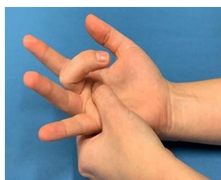
Trigger finger middle finger Rt hand

คนไข้ที่มีปัญหาเรื่องนิ้วล็อก (trigger finger) หรือพังผืดข้อมือรัดเส้นประสาท( carpal tunnel syndrome) มีข้อบ่งชี้ต้องผ่าตัด แผลผ่าตัดมีขนาด ประมาณ ๑-๒ เซ็นติเมตร ในปัจจุบันบางครั้งมีความกว้างของอุปกรณ์ถ่างแผล ( senn retractor) ที่ใหญ่ ทำให้เป็นอุปสรรคต่อการผ่าตัด ที่มุ่งเน้นให้เกินแผลผ่าตัดที่เล็กที่สุด(minimal invasive surgery) จึงมีแนวคิดว่า ทำเครื่องมือถ่างแผลที่มีขนาดเล็ก เพื่อจะต้องไม่ต้องเปิดแผลที่ใหญ่ และช่วยให้แพทย์ผ่าตัดได้สะดวกขึ้น