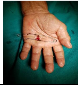
A1 pulley release ring finger Rt hand