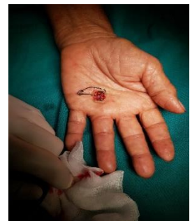
A1 pulley release ring finger Rt hand