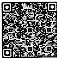
อินโฟกราฟิก