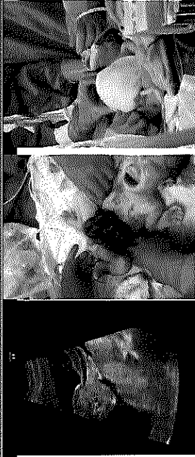
รูปที่ 1 Gastroschisis at first diagnosis GA 21 st weeks (กรณีนี้ถึงขั้นครั้งแรก GA 21 st สัปดาห์) รูปที่ 2 และ 3 ทารกแรกเกิดในท้องแม่ที่ตัด

การฝึกอบรม มุ่งหวังให้ผู้เข้าอบรมเป็นผู้ที่มีความรู้ ความชำนาญด้านเวชศาสตร์มารดาและทารก จะต้องมีความรู้พื้นฐานแห่งจริยธรรม มโนคติที่สอดคล้องกับเวชศาสตร์มารดาและทารก ใ้บริการรับบาล อย่างองค์รวม ที่ประกอบด้วยการสร้างเสริมสุขภาพ ป้องกัน รักษา และฟื้นฟูสุขภาพ รวมทั้งบริหารทรัพยากร อย่างมีประสิทธิภาพและประสิทธิผล ศึกษา ค้นคว้า วิจัย การอย่างต่อเนื่อง และเผยแพร่ไปสู่สาธารณะชนเพื่อบริการ การฝึกอบรมในหลักสูตรนี้จึงกำหนดให้เมื่อผ่านการฝึกอบรม ผู้เรียนสาขาเวชศาสตร์มารดาและทารก จะมีความรู้ความสามารถระดับสูงในการดูแลปัญหาทางเวชศาสตร์มารดาและทารกที่ซับซ้อนอย่างมีมาตรฐานตามองค์ความรู้ที่ถูกต้องและทันสมัย - มีความรู้ความสามารถระดับสูงในการดูแลปัญหาทางเวชศาสตร์มารดาและทารกที่ซับซ้อนอย่างมีมาตรฐานตามองค์ความรู้