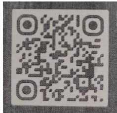
คู่มือปฏิบัติงาน ห้องยา