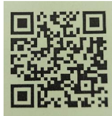
_งานระบบ HCIS (ส่งคมสเกราะห้)