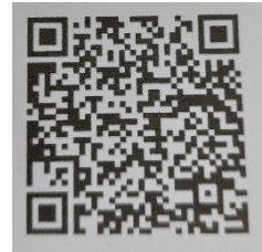
ระบบ Krungthai Digital Health Platform บันทึกัด กรองสุขภาพ ประชาชน