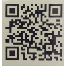
_งานระบบ HCIS (เวชระเบียบ)