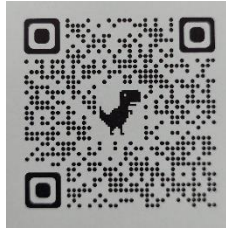
โปรแกรม Health Survey