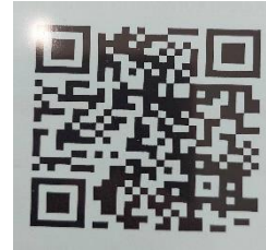
คู่มือจุดเตรียมตรวจ