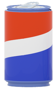
ดื่มน้ำหวาน