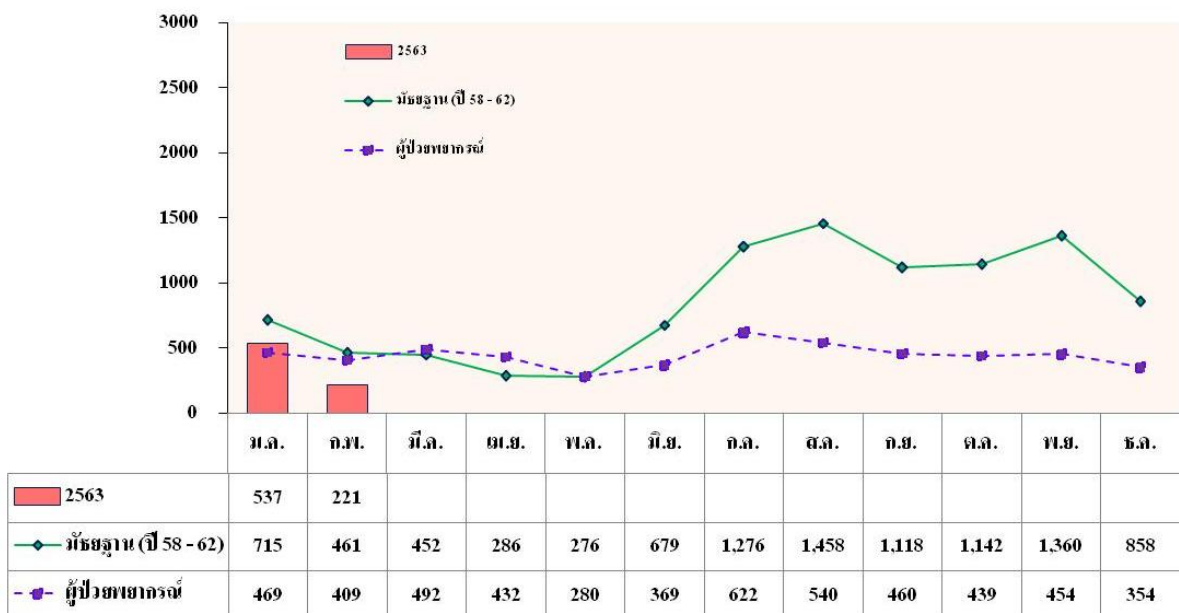
จำนวนผู้ป่วย (ราย)

แผนภูมิที่ 1 จำนวนผู้ป่วยโรคไข้เลือดออก ในกรุงเทพมหานคร สัปดาห์ที่ 7 ปี 2563 จำแนกรายเดือน เปรียบเทียบค่ามัธยฐาน 5 ปี ย้อนหลัง (ปี 2558 – 2562) และผู้ป่วยพยากรณ์