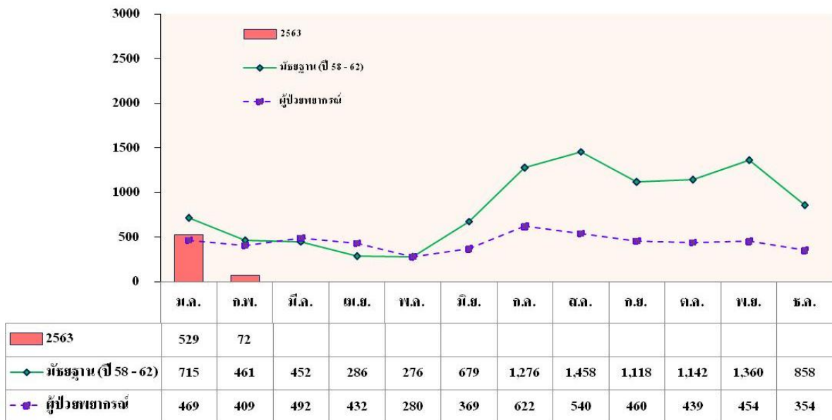
จำนวนผู้ป่วย (ราย)

แผนภูมิที่ 1 จำนวนผู้ป่วยโรคไข้เลือดออก ในกรุงเทพมหานคร สัปดาห์ที่ 5 ปี 2563 จำแนกรายเดือน เปรียบเทียบค่ามัธยฐาน 5 ปี ย้อนหลัง (ปี 2558 – 2562) และผู้ป่วยพยากรณ์