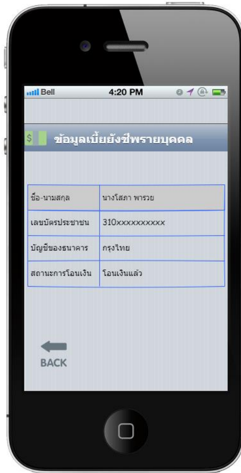
รูปภาพที่ 3 หน้าแสดงข้อมูลรายละเอียดของผู้ได้รับเบี้ยยังชีพในแอปพลิเคชัน”เบี้ยยังชีพ”

รูปภาพที่ 3 เป็นรูปภาพหน้าที่ 3 ของแอปพลิเคชัน”เบี้ยยังชีพ” แสดงผลข้อมูลรายละเอียดของผู้ที่ได้รับเบี้ยยังชีพ ได้แก่ ชื่อและนามสกุลของผู้ได้รับเบี้ยยังชีพ เลขบัตรประชาชน บัญชีของธนาคาร และสถานะการโอนเงินซึ่งระบุเป็นประโยคได้ทั้งหมด 2 รูปแบบ ได้แก่ “โอนเงินแล้ว” เมื่อเจ้าหน้าที่ได้โอนเงินเบี้ยยังชีพเข้าบัญชีธนาคารของผู้ที่ได้รับเงินเบี้ยยังชีพแล้ว และ”ยังไม่ได้โอนเงิน” เมื่อเจ้าหน้าที่ยังไม่ได้โอนเงินเบี้ยยังชีพเข้าบัญชีธนาคารของผู้ที่ได้รับเงินเบี้ยยังชีพ นอกจากนี้ยังมีปุ่มลูกศรย้อนกลับ (back) แกว่ด้านล่างของหน้าแสดงข้อมูลรายละเอียดของผู้ได้รับเบี้ยยังชีพในแอปพลิเคชันโดยสร้างขึ้นเพื่อให้ผู้ใช้บริการสามารถย้อนกลับไปหน้าระบบ login ในหน้าที่ 2 ได้