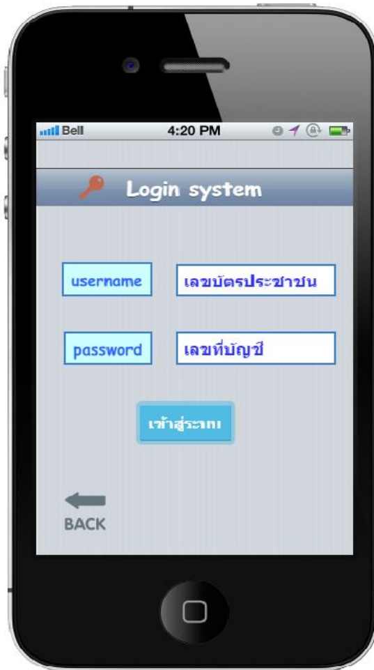
รูปภาพที่ 2 หน้าระบบ login ของแอปพลิเคชัน”เบี๋ยยังชีพ”

รูปภาพที่ 2 เป็นรูปภาพหน้าที่ 2 ของแอปพลิเคชัน”เบี๋ยยังชีพ” ซึ่งแสดงผลระบบ login เพื่อเข้าสู่ระบบ แสดงผลข้อมูลรายละเอียดในหน้าถัดไป หน้าระบบ login มีช่องให้กรอกข้อมูลทั้งหมด 2 ช่องเพื่อเข้าสู่ระบบ ได้แก่ ช่อง username และช่อง password ในช่อง username ผู้ใช้บริการกรอกเลขบัตรประชาชนลงไป ช่องว่างนั้นและช่อง password ผู้ใช้บริการกรอกเลขที่บัญชีในช่องว่างถัดมา เหตุผลในการให้กรอกเลขบัตรประชาชนและเลขที่บัญชีคือเพื่อสร้างความปลอดภัยแก่ผู้ที่ได้สิทธิ์รับเบี๋ยยังชีพ และปุ่มลูกศรย้อนกลับ (back) แถวด้านล่างของหน้าระบบ login สร้างเพื่อย้อนกลับไปในหน้าแรกของแอปพลิเคชัน”เบี๋ยยังชีพ”