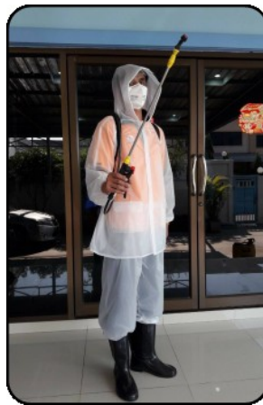
ชุดป้องกันแบบที่ 2