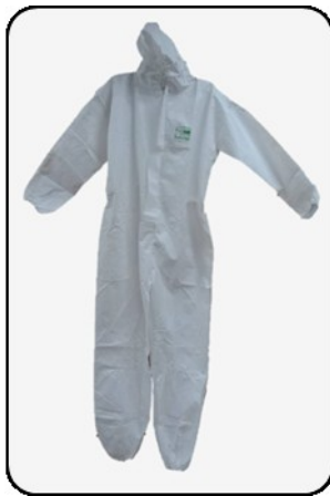
ชุดป้องกันแบบที่ 1