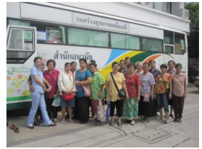
การตรวจคัดกรองวัณโรคปอด โดยรถเอกซเรย์เคลื่อนที่ สำนักอนามัย