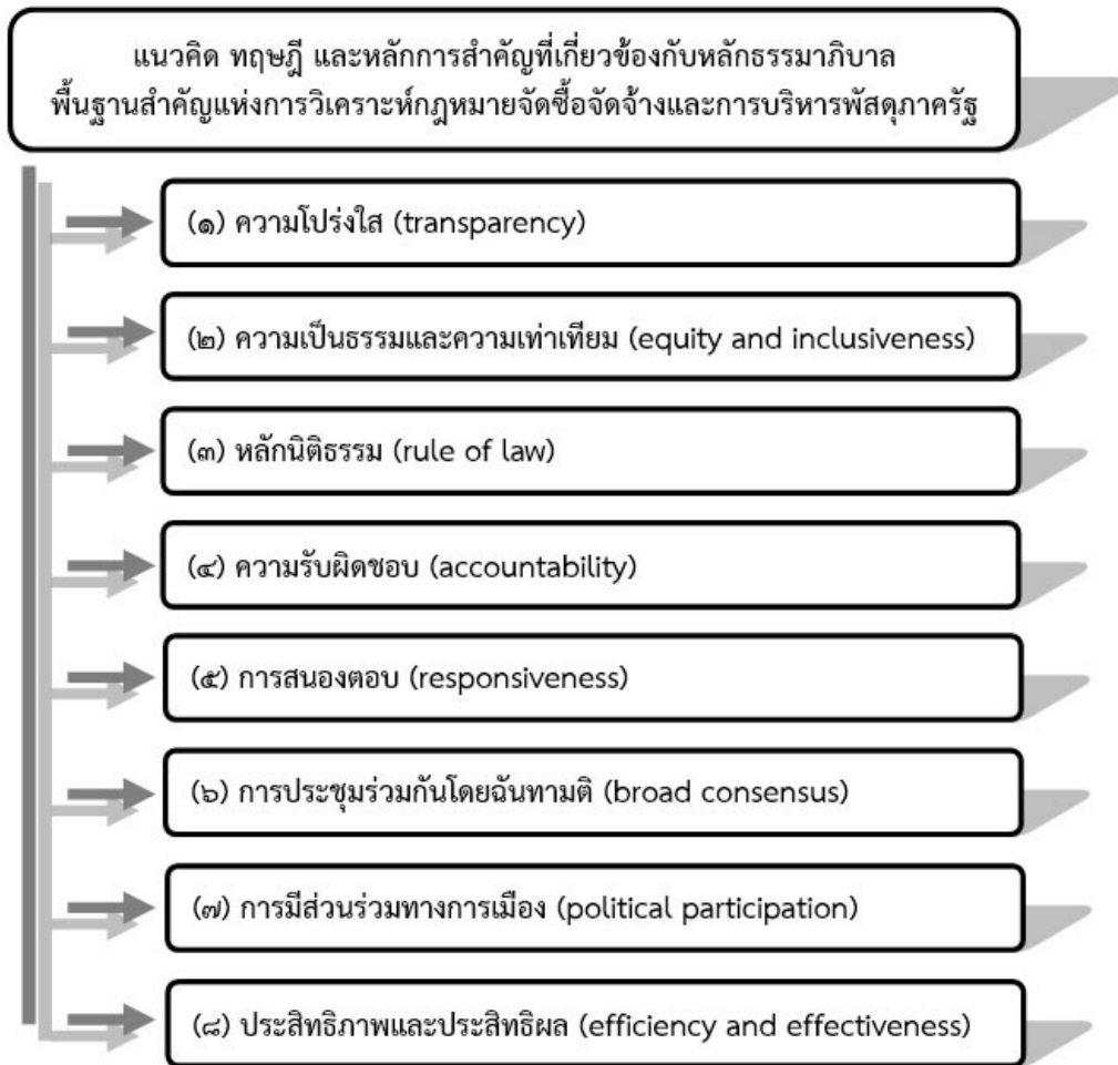
ผังแสดงแนวคิด ทฤษฎี และหลักการสำคัญที่เกี่ยวข้องกับหลักธรรมาภิบาล ซึ่งเป็นพื้นฐานสำคัญแห่งการวิเคราะห์กฎหมายการจัดซื้อจัดจ้างและการบริหารพัสดุภาครัฐ