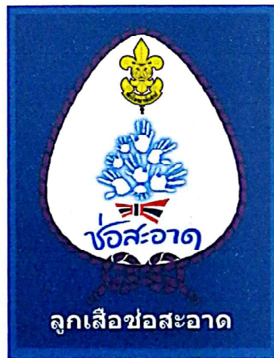
แบบจ้กูกเสื่อสามัญรุ่นใหญ่ซอสะอาด