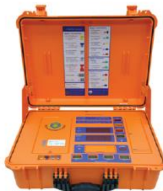
เครื่องรวมคะแนน รุ่นที่ 4

เครื่องลงคะแนนเลือกตั้งต้นแบบรุ่นที่ ๔ ถูกพัฒนาขึ้นเป็นรุ่นล่าสุด ซึ่งมีคุณลักษณะพิเศษเพิ่มเติมจากรุ่นก่อนหน้า ดังนี้ (๑) เจ้าหน้าที่ที่จะต้องกดปุ่มอนุญาตก่อน เครื่องลงคะแนนจึงจะสามารถทำงานได้ (๒) สามารถรองรับผู้สมัครได้ ๓๐ หมายเลข จากเดิมมีเพียง ๒๐ หมายเลข ทำให้สามารถใช้กับการเลือกตั้งได้หลากหลายยิ่งขึ้น