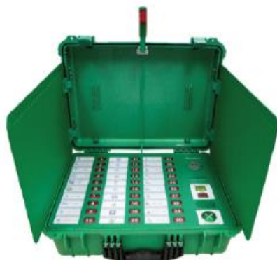
เครื่องลงคะแนน รุ่นที่ 4