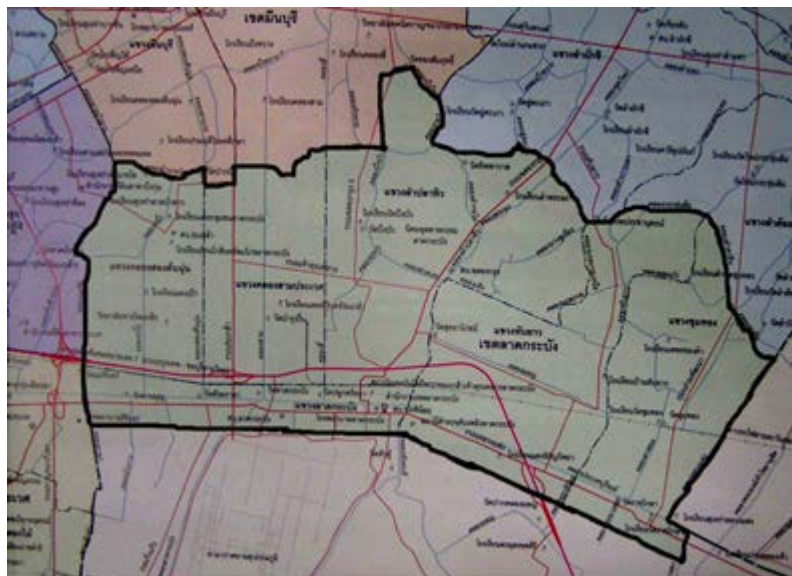
ผังเมืองรวมและแผนผังรายเขตลาดกระบัง