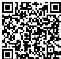
QR Code แผนที่คลองในแต่ละเขต