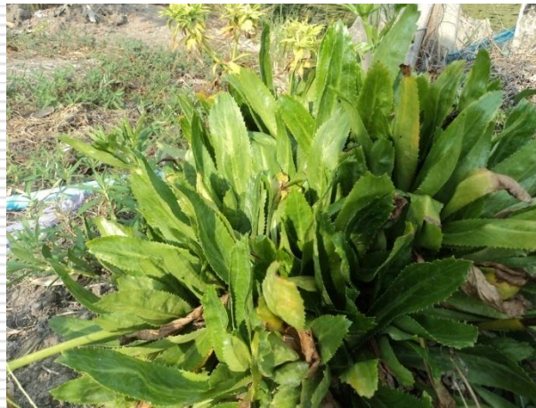
ผักชีฝรั่ง