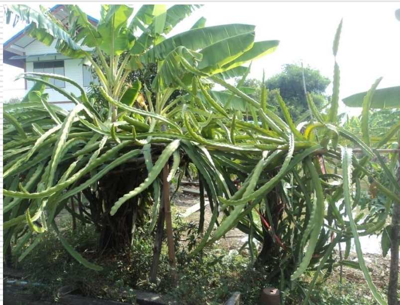
แก้วมังกร