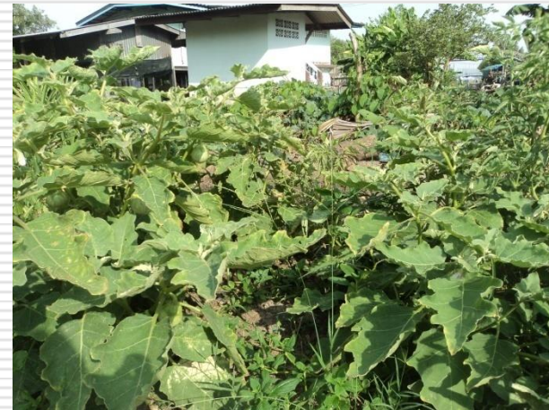
มะเขือเปราะ