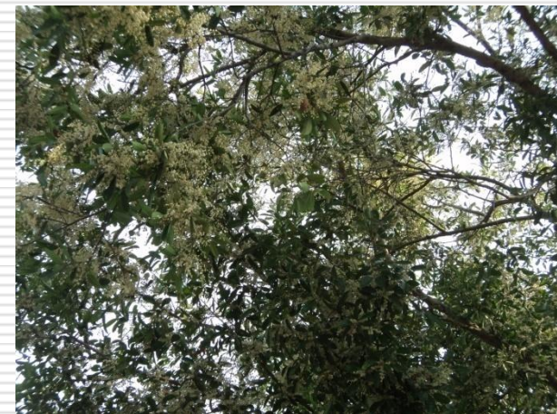
มะกอกน้ำ