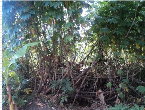
มันสำปะหลัง