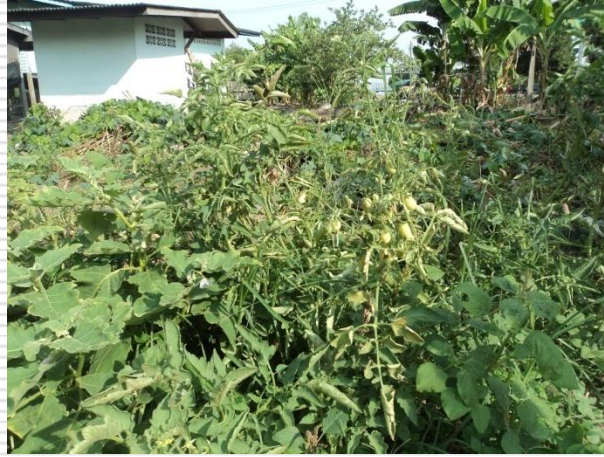
มะเขือเทศ