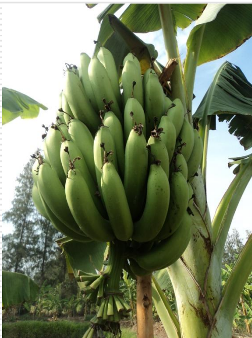
กล้วยหอม