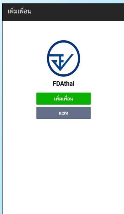
กดที่ เพิ่มเพื่อน

พิมพ์ @fdathai ที่ช่องค้นหาเพื่อน หรือสแกน QR Code