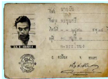
บัตรประจำตัวประชาชนรุ่นที่ 2