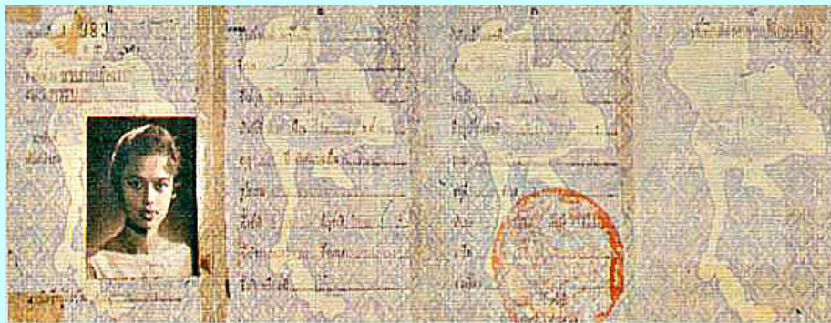
บัตรประจำตัวประชาชนรุ่นที่ 1

เช่นต้องพกบัตรติดตัวและแสดงต่อเจ้าหน้าที่ได้เสมอ ต้องขอเปลี่ยนบัตรเมื่อบัตรหมดอายุต้องแจ้งขอแก้ไขเปลี่ยนแปลงรายการในบัตรเมื่อมีการเปลี่ยนชื่อตัว ชื่อสกุล หรือที่อยู่ เป็นต้น