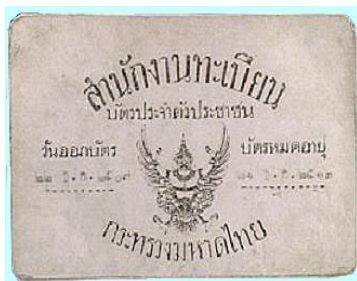
บัตรประจำตัวประชาชนรุ่นที่ 2

- ด้านหลังจะเป็นรายการของผู้ถือบัตร ประกอบด้วย รูปถ่าย ที่มีเส้นบอกส่วนสูง เป็นนิ้วฟุต ใต้รูปจะมีเลขและตัวอักษรแสดงถึงอำเภอที่ออกบัตรและเลขทะเบียนบัตรและตราประจำตำแหน่งเจ้าพนักงานออกบัตรปรากฏอยู่ทางด้านซ้าย ส่วนด้านขวาจะมีชื่อตัวชื่อสกุล วันเดือนปีเกิด อายุ ที่อยู่ และลายมือชื่อเจ้าพนักงานออกบัตร