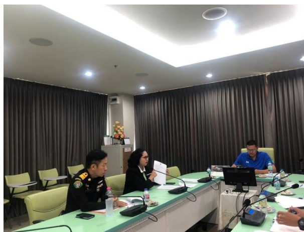
ประชุมผู้บริหารสถานศึกษาโรงเรียนในสังกัดกรุงเทพมหานคร เพื่อกำหนดนโยบายต่อต้านการรับสินบน (Anti-Bribery Policy)