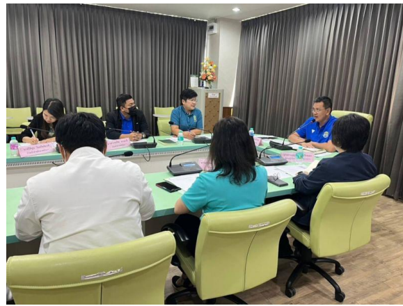
ประชุมผู้บริหารของสำนักงานเขตวังทองหลางเพื่อกำหนดนโยบายต่อต้านการรับสินบน (Anti-Bribery Policy)