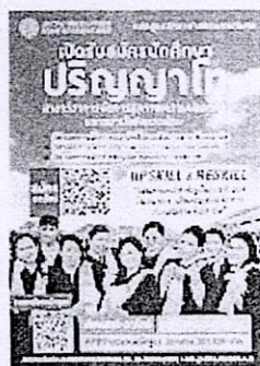
405-02-06-65 A5 ป.โท สร้างเสริม.jpg 2641K