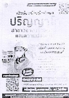
368-23-03-66 A5 ป.โท Occ copy.jpg 2018K