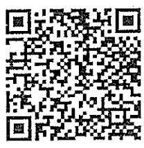
QR Code แบบประเมินตนเอง