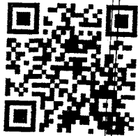
QR Code Facebook/ SooklekCartoon

๖. การประกาศผลการประกวด รายชื่อผู้ที่ได้รับรางวัลทางเพจ www.facebook.com/SookLekCartoon