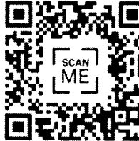
5. แบบสอบถาม สำหรับ ครู ชั้น ป.4-6