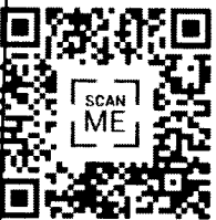
4. แบบสอบถาม สำหรับ ครู ชั้น ป.1-3