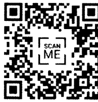
3. แบบสอบถาม สำหรับ ผู้บริหารโรงเรียน