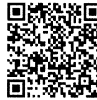
2. รยชือโรงเรียน กลุ่มตัวอย่าง