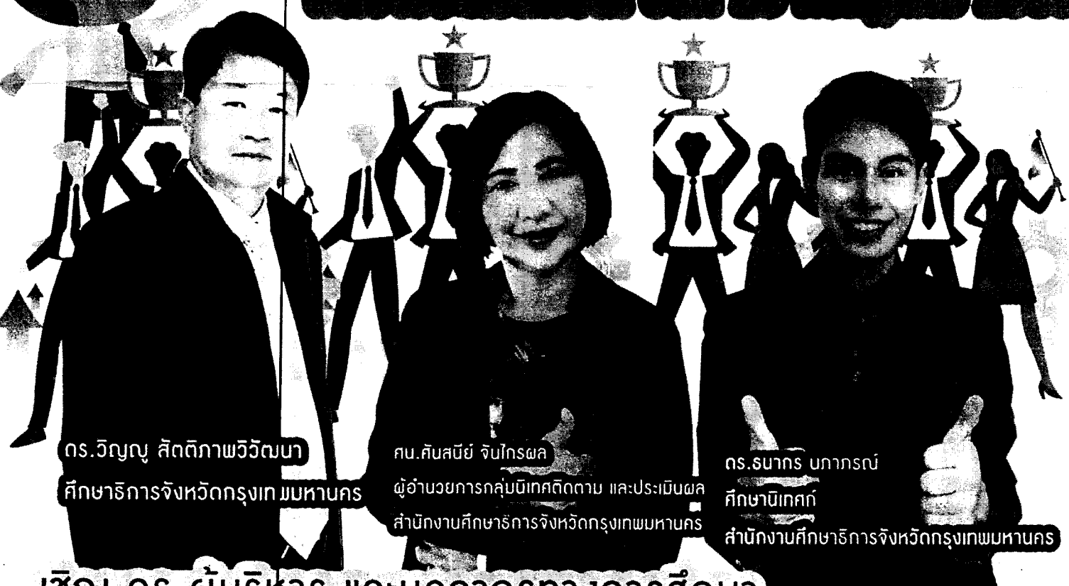
ดร.วิญญู สิตติภาพวิวัฒนา ศึกษาริการจังหวัดกรุงเทพมหานคร