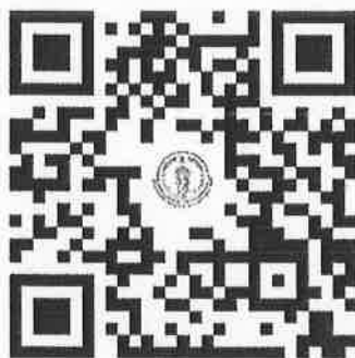
QR Code ลงทะเบียนเข้าร่วมการประมูล