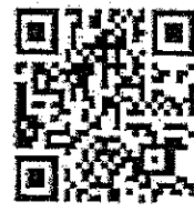
QR-Code ประกาศรับสมัคร