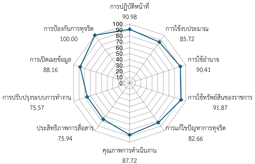
แผนภาพที่ 1 :

กราฟใยแมงมุมแสดงค่าคะแนนการประเมินคุณธรรมและความโปร่งใสในการดำเนินงานของสำนักงานเขตบึงกุ่ม กรุงเทพมหานคร ประจำปีงบประมาณ พ.ศ.2566