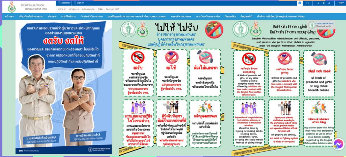
เผยแพร่ ณ จุดประชาสัมพันธ์