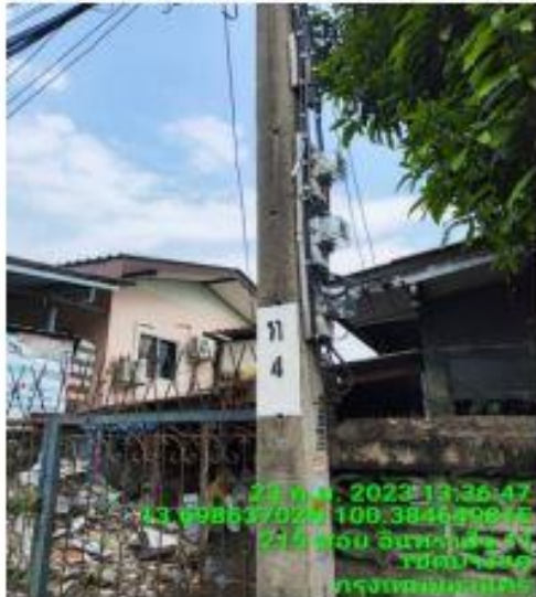
รูปถ่ายก่อนดำเนินการ

2. เรือง PB27H3 ซอยเพชรเกษม 69 แยก 7 จำนวน 4 ดวง