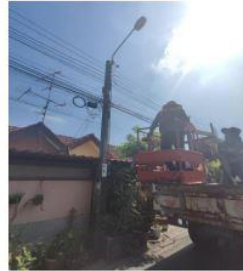
รูปถ่ายขณะดำเนินการ