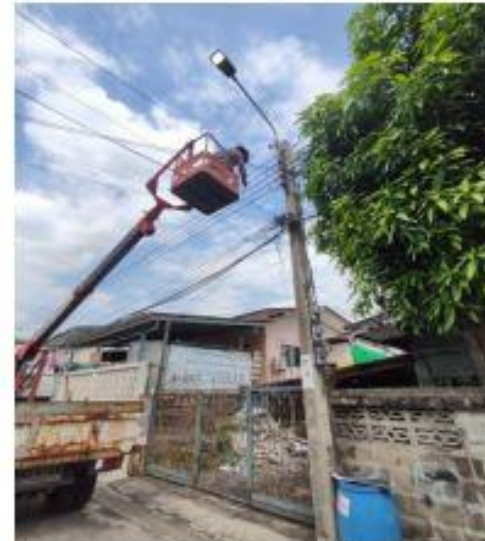
รูปถ่ายดำเนินการแล้วเสร็จ