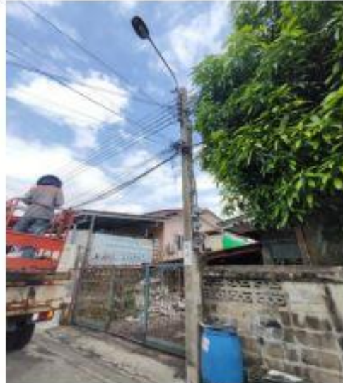
รูปถ่ายระหว่างดำเนินการ