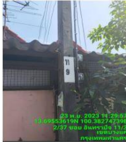
รูปถ่ายก่อนดำเนินการ