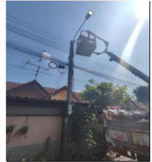
รูปถ่ายดำเนินการแล้วเสร็จ

2. เรือง PB27H3 ซอยเพชรเกษม 69 แยก 7 จำนวน 4 ดวง