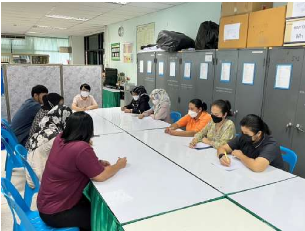
ได้จัดทำสมุดคู่มือการรับลงทะเบียนขอรับเงินค่าจัดการศพผู้สูงอายุตามประเพณี