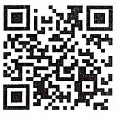
ส่งรายชื่อครูเข้ารับการอบรม