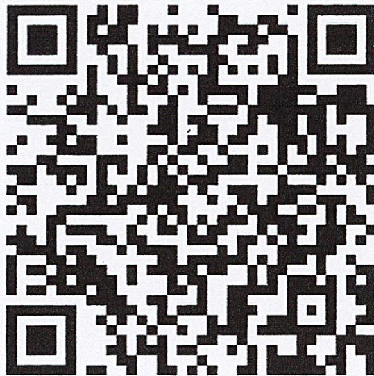
QR-code แบบฟอร์มและเอกสารอ้างอิง