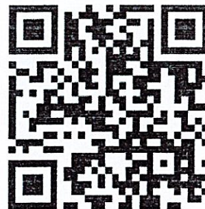
ส่งผลงานประเภทวงมโหรี