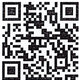
ส่งใบสมัครประเภทวงมโหรี