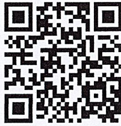
(๒) Google Form