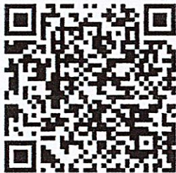
QR-code เอกสารแนบ

ปฏิบัติราชการแทนผู้อำนวยการสำนักการศึกษา