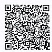
Zoom Meeting ID