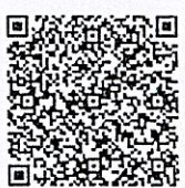
สิ่งที่ส่งมาด้วย ๑ กำหนดการ

รองเลขาธิการ ปฏิบัติราชการแทน เลขาธิการคณะกรรมการอาหารและยา