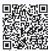
สิ่งที่ส่งมาด้วย ๒ แบบฟอร์มออนไลน์