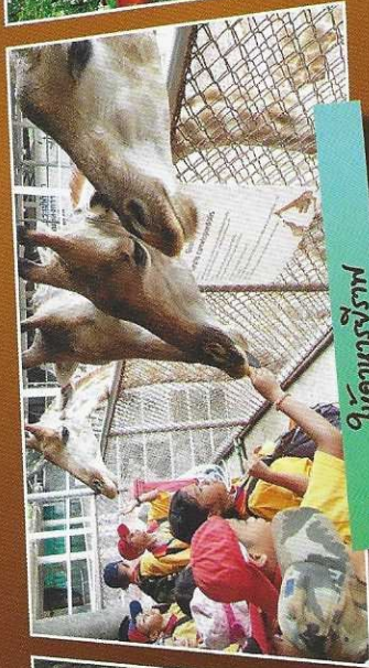
ให้อาหารจิราฟ