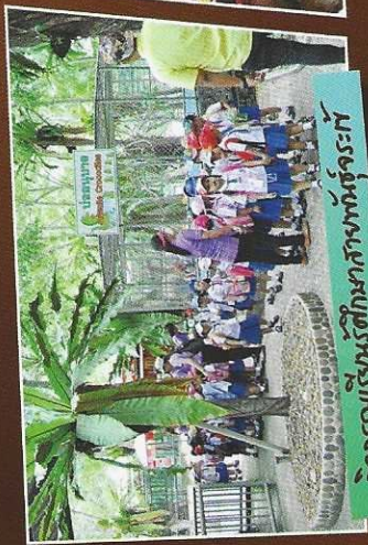
กิจกรรมเรียนรู้ศึกษาศาสตร์จระเข้