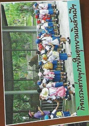
กิจกรรมต่างๆในอุทยานนันทรมิ

สวนสัตว์นานาชาติที่ท่าใหญ่ได้ยากมากกว่า 40 ชนิด เช่น เสือขาว, บ้าเผือก, ยีราฟแอฟริกา, หมิวาย เป็นต้น และยังเป็นที่ตั้งฟาร์มจระเข้ที่มีจระเข้มากถึง 20,000 ตัว ซึ่งนักเรียนจะสามารถเรียนรู้ ความแตกต่างของสายพันธุ์จระเข้แต่ละสายพันธุ์ และพฤติกรรม-การขยายพันธุ์จระเข้ อุทยานนันทรมิและฟาร์มจระเข้ที่ท่าวิทยา จึงเหมาะ เป็นแหล่งเรียนรู้สำหรับ เด็กนักเรียน นักศึกษา ได้ทุกระดับชั้น