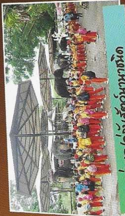
ทำบุญอุทิศส่วนกุศล