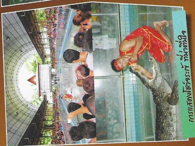
การเล็งโซ่จระเข้ ที่ท่าใหญ่