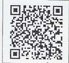
QR-Code เพื่อสอบถาม