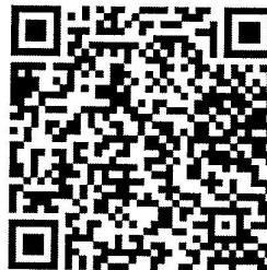
ตัวอย่างหนังสืออนุญาตผู้ปกครอง