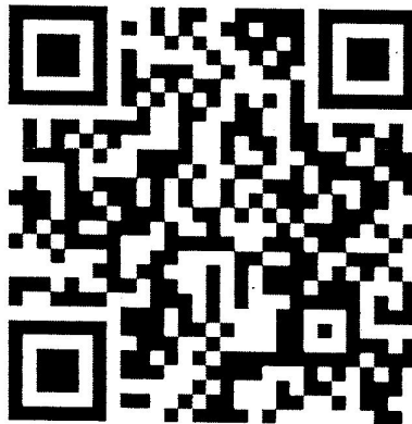
QR Code แบบสอบถาม