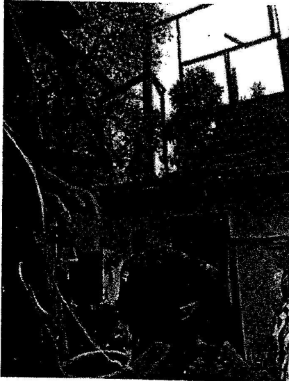
ภาพเหตุการณ์เพลิงไหม้ที่อยู่อาศัยของนักเรียนโรงเรียนวัดช่องนนทรี จากเหตุเพลิงไหม้บริเวณชุมชนข้างโรงเรียนอนุบาลลิวิลย์ ถนนนนทรี เขตยานนาวา กรุงเทพมหานคร เมื่อวันที่ ๑๘ พฤศจิกายน ๒๕๖๕ เวลา ๐๙.๐๐ น.