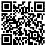
QR Code ลงทะเบียน ตอบรับการประชุมฯ

ปฏิบัติราชการแทนผู้อำนวยการสำนักการศึกษา