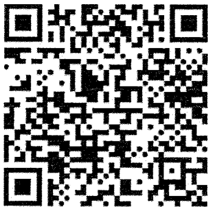
ลงทะเบียน

ศูนย์กลางการจัดประชุม : บริเวณภายในสำนักงาน ป.ป.ช.