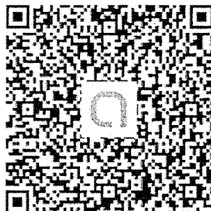
ครั้งที่ ๓ กทม.