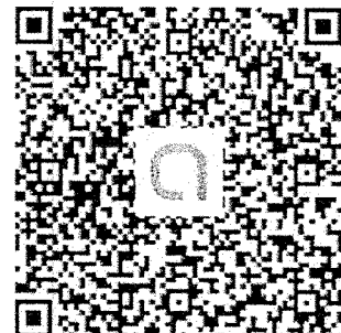
ครั้งที่ ๔ นนทบุรี

เอกสารประกอบการอบรมสร้างวิทยากรตัวคุณในการปลูกฝังวิถีคิดแยกแยะผลประโยชน์ส่วนตนและผลประโยชน์ส่วนรวม ประจำปี ๒๕๖๕ (ในรูปแบบ e-Book)