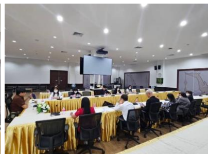
การประชุม เมื่อวันที่ 25 มกราคม 2567