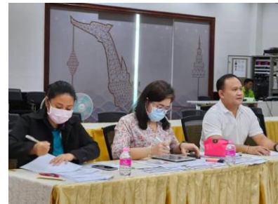
การประชุม เมื่อวันที่ 6 ธันวาคม 2566