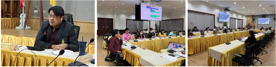
การประชุม เมื่อวันที่ 27 กุมภาพันธ์ 2567