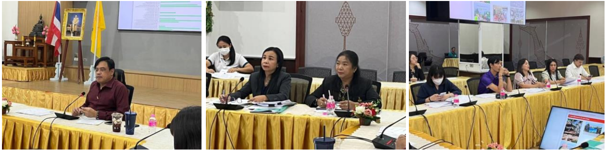
การประชุม เมื่อวันที่ 13 มีนาคม 2567