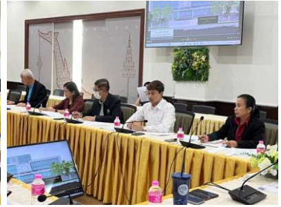
การประชุม เมื่อวันที่ 11 มกราคม 2567