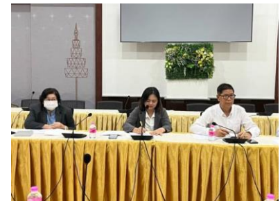
การประชุม เมื่อวันที่ 20 ธันวาคม 2566