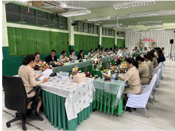
การประชุมผู้บริหารสถานศึกษาโรงเรียนในสังกัดกรุงเทพมหานคร