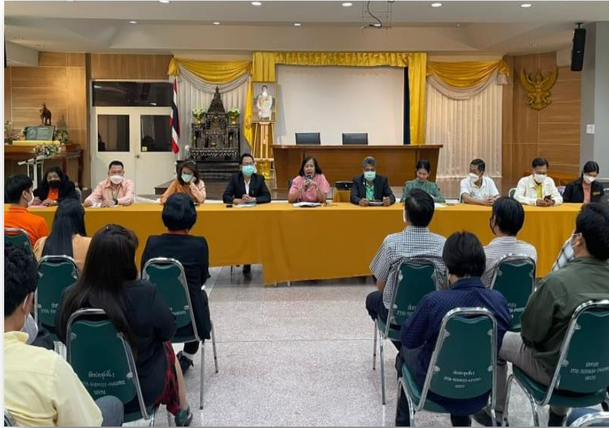
ผู้อำนวยการเขตประชุมชี้แจง ให้ข้อมูล ชักซ้อมความเข้าใจการดำเนินงาน ITA ให้กับข้าราชการ บุคลากรสำนักงานเขตตลิ่งชัน เมื่อวันที่ ๒๖ มกราคม ๒๕๖๖ ณ ห้องประชุมชั้น ๓ สำนักงานเขตตลิ่งชัน