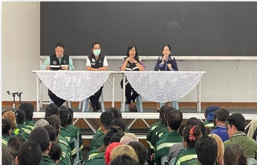
ผู้อำนวยการเขตตลิ่งชัน ประชุมลูกจ้างฝ่ายรักษาความสะอาดและสวนสาธารณะ ทำความเข้าใจการดำเนินงาน ITA เมื่อวันที่ ๘ กุมภาพันธ์ ๒๕๖๖ ณ วัดอินทราวาส