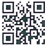
แนวทางการปฏิบัติ ในการใช้ดุลยพินิจของเจ้าหน้าที่