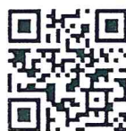
แบบฟอร์ม รายการตรวจสอบ (Checklist) ในการพิจารณาออกใบอนุญาต