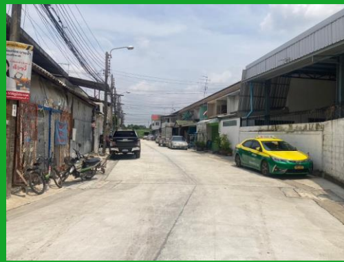
หลังดำเนินการ