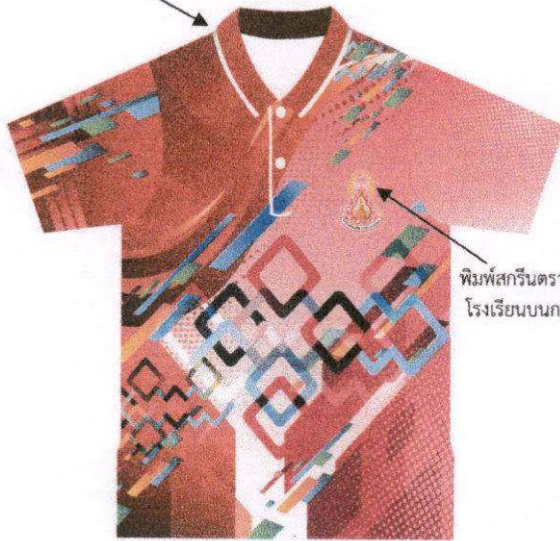
ด้านหน้า