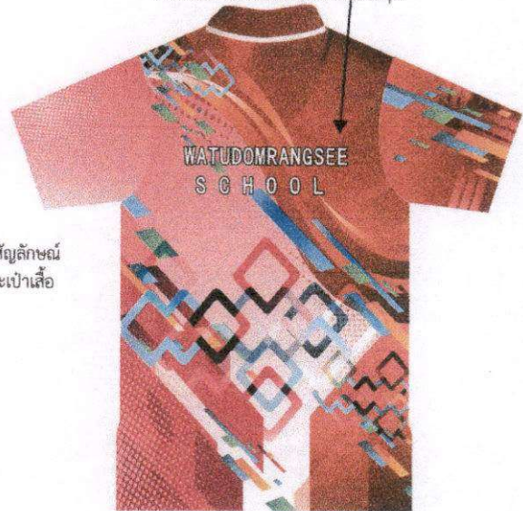
ด้านหลัง

พิมพ์สกรีนตราสัญลักษณ์ โรงเรียนบนกระเป่าเสื้อ