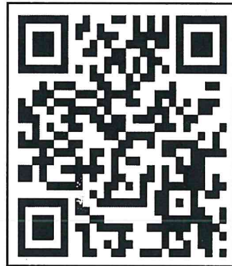
เอกสารที่เกี่ยวข้อง